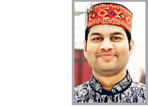
(लेखक स्वतंत्र फकर है, ये उनके अपने विचार हैं।)