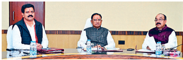
हरिभूमि न्यूज ►► रायपुर

इन चुनावों को प्रत्यक्ष तरीके से कराने का निर्णय लिया है। कैबिनेट की बैठक में विभिन्न धाराओं में संशोधन किए जाने के संबंध में अध्यादेश 2024 के प्रारूप का अनुमोदन किया गया है।