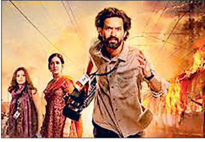
हरिभूमि न्यूज ▶▶ नई दिल्ली

रायपुर, मंगलवार 3 दिसंबर 2024 haribhoomi.com