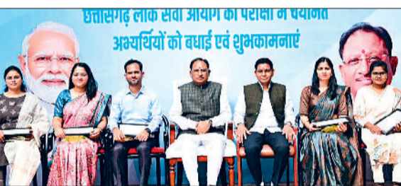
हरिभूमि न्यूज ►► रायपुर

पीएससी टॉपर्स से मिले सीएम, कहा- पारदर्शिता से करें दायित्वों का निर्वहन