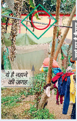
ये है नहाने की जगह

■ विद्यालय के प्राचार्य पर एफआईआर दर्ज करने की उठी मांग