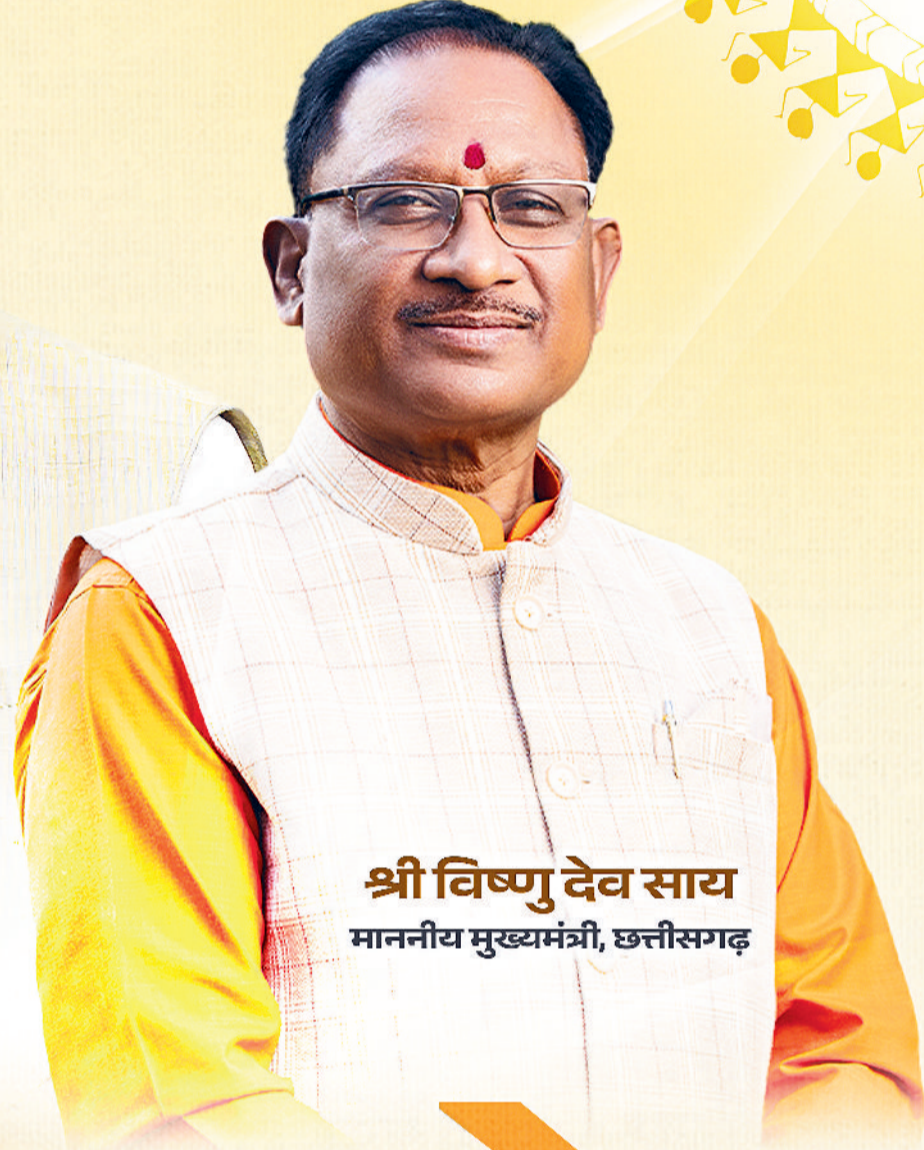
श्री विष्णु देव साय माननीय मुख्यमंत्री, छत्तीसगढ़