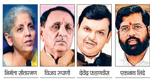
निर्मला सीतारमण विजय रूपाणी देवेन्द्र फडणवीस एकनाथ शिंदे

फडणवीस ने शिंदे को किया फोन उपमुख्यमंत्री देवेन्द्र फडणवीस ने सोमवार को कार्यवाहक मुख्यमंत्री एकनाथ शिंदे को फोन कर उनके स्वास्थ्य के बारे में जानकारी ली। बता दें कि शनिवार को शिंदे की अपने गहनगर सतारा में तबीयत बिगड़ गई थी। उसके बाद वह आज सुबह ही मुंबई लौटे हैं। हालांकि, डॉक्टरों के उन्हें आराम करने की सलाह देने के बाद उन्होंने अपने सभी कार्यक्रम निरस्त कर दिए हैं। सभी को उम्मीद थी कि शिंदे के सतारा से लौटने के बाद स्थिति स्पष्ट होगी, लेकिन अब उनकी तबीयत बिगड़ गई।